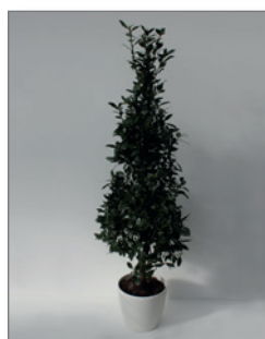
Lorbeer, Pyramide (Laurus nobilis)* Pos.-Nr. 62-206

120 cm bis 140 cm (01) EUR 45,00 180 cm bis 200 cm (02) EUR 78,00 201 cm bis 240 cm (03) EUR 130,00 340 cm bis 400 cm (04) EUR 350,00