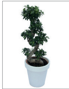
Zimmerbonsai (Ficus microcarpa ginseng) Pos.-Nr. 62-222