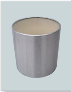
Edelstahl-Übertopf (zur Miete) Pos.-Nr. 62-221