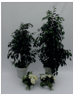
Pflanzen-Set A Pos.-Nr. 62-214

bestehend aus: 1 x Ficus benjamina 160 bis 180 cm 1 x Ficus benjamina 100 bis 120 cm 2 x Tischschalen ø 15 cm, grün / weiß bepflanzt