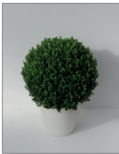
Buxbaum, Kugel (Buxus sempervirens)* Pos.-Nr. 62-209

80 cm bis 100 cm (01) EUR 44,00 Kugeldurchmesser: 40 bis 50 cm