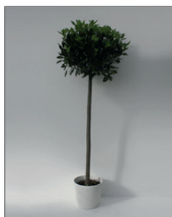
Lorbeer, Kugel (Laurus nobilis)* Pos.-Nr. 62-205

140 cm bis 160 cm (01) EUR 48,00 161 cm bis 180 cm (02) EUR 57,00 181 cm bis 200 cm (03) EUR 69,00