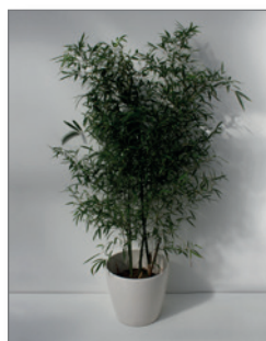
Bambus (Phyllostachys bissetii)* Pos.-Nr. 62-208

120 cm bis 140 cm (01) EUR 38,00 160 cm bis 180 cm (02) EUR 56,00 181 cm bis 200 cm (03) EUR 59,00 250 cm bis 300 cm (04) EUR 90,00