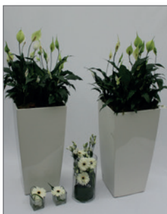
Pflanzen-Set C Pos.-Nr. 62-216

bestehend aus: 2 x Lechuza-Vase, weiß, 75 cm hoch, grün bepflanzt, 2 x kleine Tischvasen (Glas) mit weiß/ grünen Schnittblumen, 1 x kleine Thekenvase mit weißen, saisonalen Schnittblumen, Gesamthöhe: ca. 40 cm