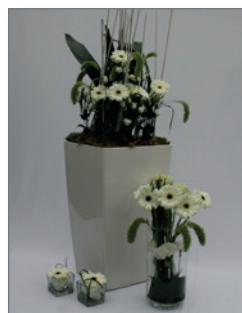
Pflanzen-Set D Pos.-Nr. 62-217

bestehend aus: 2 x Lechuza-Vase, weiß, 75 cm hoch, grün bepflanzt, 2 x kleine Tischvasen (Glas) mit weiß/ grünen Schnittblumen, 1 x kleine Thekenvase mit weißen, saisonalen Schnittblumen, Gesamthöhe: ca. 40 cm