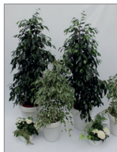
Pflanzen-Set B Pos.-Nr. 62-215

bestehend aus: 2 x Ficus benjamina 160 bis 180 cm 1 x Tischschale ø 15 cm 1 x Thekenshale ø 20 cm 2 x Grünpflanzen bis 80 cm