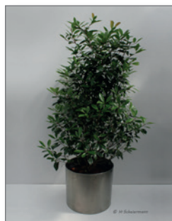
Glanzmispel, Busch (Photinia fraseri)* Pos.-Nr. 62-211