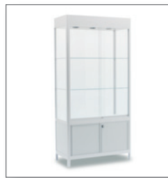
Schrankvitrine ELEXANA EUR 235,20 Pos.-Nr. 01-214

Maße: B: 48 cm / T: 48 cm / H: 203 cm Drehtüren, abschließbar, mit Beleuchtung