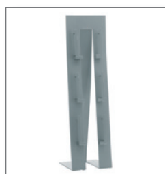
Prospektständer KIOS EUR 46,60 Pos.-Nr. 01-270