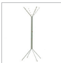
Garderobenständer ALUCLAC EUR 40,20 Pos.-Nr. 01-291

Maße: B: 77 cm / T: 77 cm / H: 113,5 cm hinterleuchtet, 1 Einlegeboden