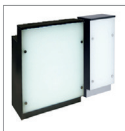
Theke LUNA 1,0R EUR 262,40 Pos.-Nr. 01-100 Theke LUNA 0,5R EUR 219,60 Pos.-Nr. 01-101

Maße: B: 100 cm / T: 70 cm / H: 110 und 90 cm Schiebetüren, abschließbar 2 Einlegeböden