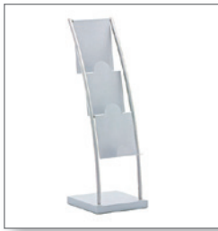
Prospektständer PARTNER EUR 33,80 Pos.-Nr. 01-295