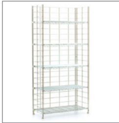
Lagerregal SHOPLINE EUR 76,00 Pos.-Nr. 01-223

Maße: B: 61 cm / T: 31 cm / H: 200 cm 4 Einlegeböden