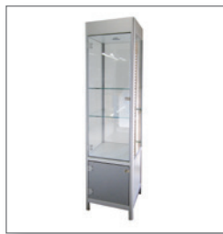
Hochvitrine ELEXANA EUR 203,10 Pos.-Nr. 01-298