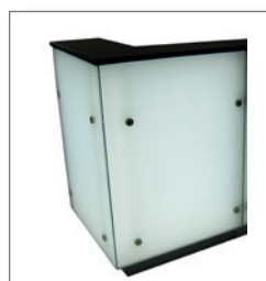
Theke LUNA Eckelement EUR 262,40 Pos.-Nr. 01-102

Maße: B: 99 cm + 49,5 cm / T: 77 cm / H: 113,5 cm hinterleuchtet, 1 Einlegeboden