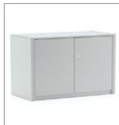
Sideboard Kiel EUR 91,70 Pos.-Nr. 01-127

Maße: B: 90 cm / T: 45 cm / H: 74 cm Schiebetüren, abschließbar 1 Einlegeboden