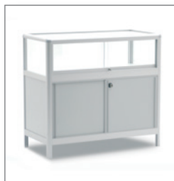
Tischvitrine ELEXA EUR 128,00 Pos.-Nr. 01-213

Maße: B: 98 cm / T: 48 cm / H: 203 cm Schiebetüren, abschließbar, mit Beleuchtung