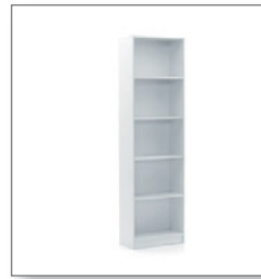
Regal ABACUS EUR 59,00 Pos.-Nr. 01-141

Maße: B: 35 cm / T: 25 cm / H: 130 cm 3 Einschubfächer DIN A4 Gestell: verchromt, Fächer Edelstahl