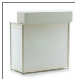
Theke OCTA mit Aufsatz EUR 194,30 Pos.-Nr. 01-312 Theke OCTA ohne Aufsatz EUR 171,10 Pos.-Nr. 01-313

Maße: B: 99 cm / T: 85 cm / H: 115 und 90 cm abschließbar, 1 Einlegeboden