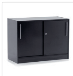
Sideboard BOSTON EUR 91,00 Pos.-Nr. 01-297

Maße: B: 90 cm / T: 45 cm / H: 75 cm Drehtüren, abschließbar 1 Einlegeboden