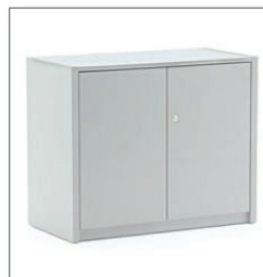
Sideboard ATLANTA EUR 96,00 Pos.-Nr. 01-296

Maße: B: 98 cm / T: 48 cm / H: 90 cm Vitrinenraum und Schrankraum mit Schiebetüren, abschließbar