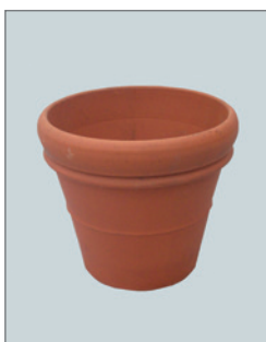
Keramik-Übertopf (zur Miete) Pos.-Nr. 62-220

Abbildung: mit Zamiculcas bepflanzt (02) Maße: B: 100 cm / T: 40 cm / H: 80 cm