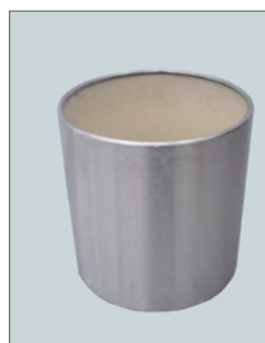
Edelstahl-Übertopf (zur Miete) Pos.-Nr. 62-221