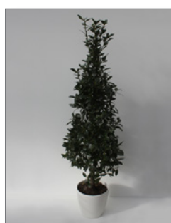
Lorbeer, Pyramide (Laurus nobilis)* Pos.-Nr. 62-206

120 cm bis 140 cm (01) EUR 45,00 180 cm bis 200 cm (02) EUR 78,00 201 cm bis 240 cm (03) EUR 130,00 340 cm bis 400 cm (04) EUR 350,00