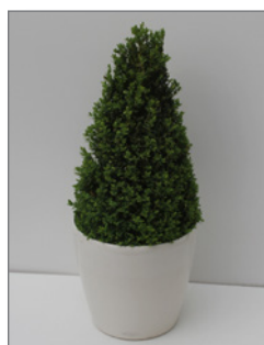
Buxbaum, Pyramide (Buxus sempervirens)* Pos.-Nr. 62-210

130 cm bis 150 cm (02) EUR 105,00 Kugeldurchmesser: 80 bis 100 cm