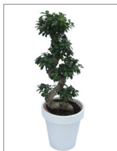
Zimmerbonsai (Ficus microcarpa ginseng) Pos.-Nr. 62-222