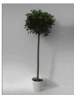
Lorbeer, Kugel (Laurus nobilis)* Pos.-Nr. 62-205

140 cm bis 160 cm (01) EUR 48,00 161 cm bis 180 cm (02) EUR 57,00 181 cm bis 200 cm (03) EUR 69,00