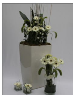
Pflanzen-Set D Pos.-Nr. 62-217

bestehend aus: 2 x Lechuza-Vase, weiß, 75cm hoch, grün bepflanzt, 2 x kleine Tischvasen (Glas) mit weiß/ grünen Schnittblumen, 1 x kleine Thekenvase (Glas) mit weißen, saisonalen Schnittblumen, Gesamthöhe: ca. 40cm