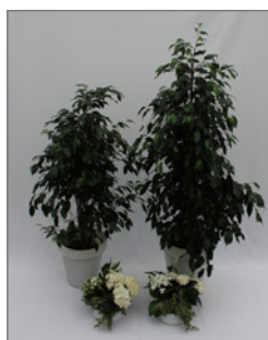
Pflanzen-Set A Pos.-Nr. 62-214

bestehend aus: 1 x Ficus benjamina 160 bis 180 cm 1 x Ficus benjamina 100 bis 120 cm 2 x Tischschalen ø 15 cm, grün / weiß bepflanzt