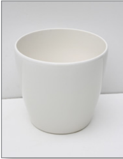
Hochglanz-Übertopf (zur Miete) Pos.-Nr. 62-227