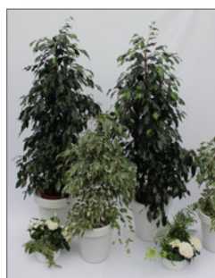
Pflanzen-Set B Pos.-Nr. 62-215

bestehend aus: 2 x Ficus benjamina 160 bis 180 cm 1 x Tischschale ø 15 cm 1 x Thekenshale ø 20 cm 2 x Grünpflanzen bis 80 cm