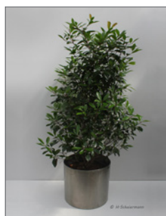
Glanzmispel, Busch (Photinia fraseri)* Pos.-Nr. 62-211