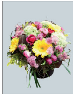
Blumensträuße (zum Kauf) Pos.-Nr. 62-175

je nach Größe und Wahl der Blumen ab 25 EUR