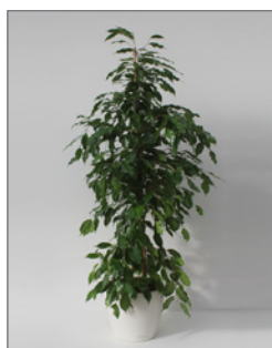
Birkenfeige (Ficus benjamina)* Pos.-Nr. 62-200

120 cm bis 140 cm (01) EUR 34,00 141 cm bis 160 cm (02) EUR 38,00 180 cm bis 200 cm (03) EUR 45,00 201 cm bis 220 cm (04) EUR 60,00