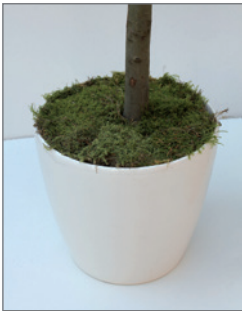
Abdeckung sichtbarer Töpfe mit Moos Pos.-Nr. 62-218