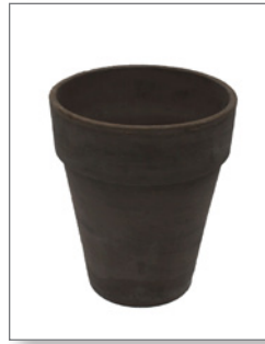
Keramik-Übertopf (zur Miete) Höhe ca. 50 cm Pos.-Nr. 62-226