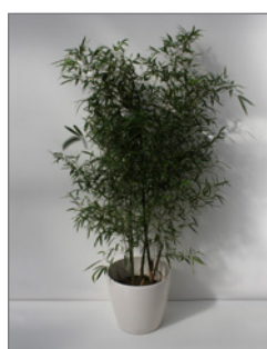
Bambus (Phyllostachys bissetii)* Pos.-Nr. 62-208

120 cm bis 140 cm (01) EUR 38,00 160 cm bis 180 cm (02) EUR 56,00 181 cm bis 200 cm (03) EUR 59,00 250 cm bis 300 cm (04) EUR 90,00