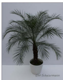
Dattelpalme (Phoenix roebelenii)* Pos.-Nr. 62-207

160 cm bis 180 cm (01) EUR 58,00 181 cm bis 200 cm (02) EUR 77,00