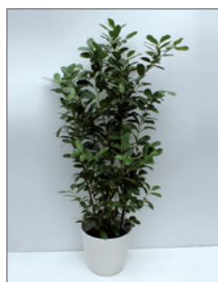
Kirschlorbeer (Prunus laurocerasus)* Pos.-Nr. 62-213

140 cm bis 160 cm (01) EUR 39,50 161 cm bis 180 cm (02) EUR 47,00 181 cm bis 200 cm (03) EUR 51,00 201 cm bis 220 cm (04) EUR 66,00