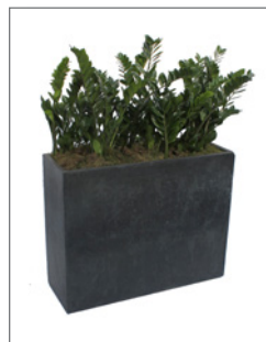
Bepflanztes Betongefäß (zur Miete) (Steingefäß, anthrazith) Pos.-Nr. 62-225

Abbildung: mit Spathiphyllum bepflanzt (01) Maße: B: 95 cm / T: 40 cm / H: 95 cm