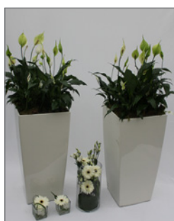
Pflanzen-Set C Pos.-Nr. 62-216

bestehend aus: 2 x Lechuza-Vase, weiß, 75cm hoch, grün bepflanzt, 2 x kleine Tischvasen (Glas) mit weiß/ grünen Schnittblumen, 1 x kleine Thekenvase (Glas) mit weißen, saisonalen Schnittblumen, Gesamthöhe: ca. 40cm