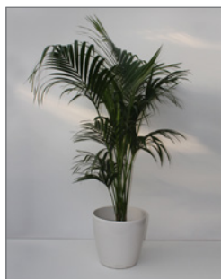
Kentia-Palme (Howeia fosteriana)* Pos.-Nr. 62-202

120 cm bis 140 cm (01) EUR 34,00 141 cm bis 160 cm (02) EUR 38,00 180 cm bis 200 cm (03) EUR 45,00 201 cm bis 220 cm (04) EUR 60,00