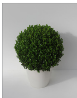
Buxbaum, Kugel (Buxus sempervirens)* Pos.-Nr. 62-209

80 cm bis 100 cm (01) EUR 44,00 Kugeldurchmesser: 40 bis 50 cm