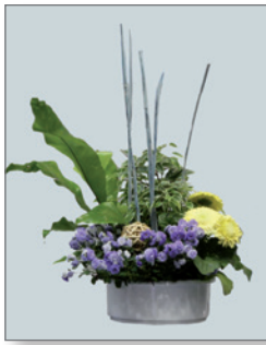
Bepflanzte Schalen (zum Kauf) Pos.-Nr. 62-230 bis Pos.-Nr. 62-232