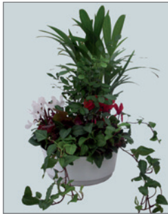
Bepflanzte Hydro-Gefäße (zur Miete) Pos.-Nr. 62-233 und Pos.-Nr. 62-235