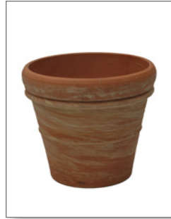
Terracotta-Übertopf (zur Miete) Pos.-Nr. 62-228