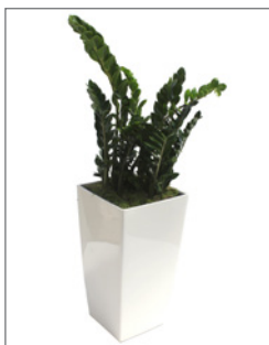
Lechuza-Vase (zur Miete) bepflanzt mit Zamio culcas, ca. 120 cm Gesamthöhe Pos.-Nr. 62-240

Abbildung: mit Zamio culcas bepflanzt (02) Maße: B: 100 cm / T: 40 cm / H: 80 cm