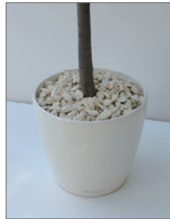
Abdeckung sichtbarer Töpfe mit Kies Pos.-Nr. 62-219