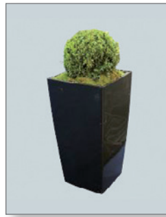
Lechuza-Vasen (zur Miete) bepflanzt mit Buxkugel Pos.-Nr. 62-236 bis Pos.-Nr. 62-238