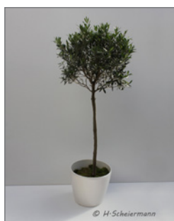
Olivenbaum, Kugel (Olea europaea)* Pos.-Nr. 62-204

140 cm bis 160 cm (01) EUR 34,00 161 cm bis 180 cm (02) EUR 39,00