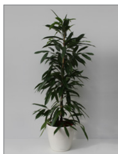
Birkenfeige (Ficus binnendijkii alii)* Pos.-Nr. 62-201

120 cm bis 140 cm (01) EUR 34,00 141 cm bis 160 cm (02) EUR 38,00 180 cm bis 200 cm (03) EUR 45,00 201 cm bis 220 cm (04) EUR 60,00