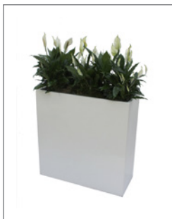
Bepflanzter Raumtrenner (zur Miete) (hochglanz weiß) Pos.-Nr. 62-224

je nach Größe und Wahl der Blumen ab 25 EUR