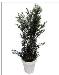
Ilex - Busch (Ilex crenata) Pos.-Nr. 62-223