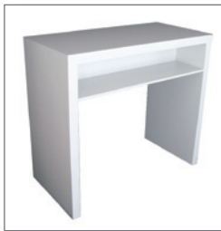
Theke ANGELO EUR 131,00 Pos.-Nr. 61-272

Maße: B: 110 cm / T: 62 cm / H: 110 cm abschließbar, 1 Einlegeboden