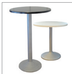
Tisch 70 Pos.-Nr. 61-276 EUR 53,00 Stehtisch 110 Pos.-Nr. 61-278 EUR 59,00 Platte: weiß (01) Platte: schwarz (02) Platte: Buche Dekor (16) Maße: H: 70 cm + 110 cm ø Platte: 70 cm Gestell: silber