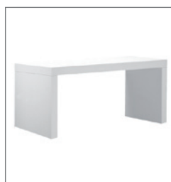
Besprechungstisch LEVANTE 75 EUR 154,00 Pos.-Nr. 61-232 weiß (01) Maße: B: 120 cm / T: 60 cm / H: 75 cm