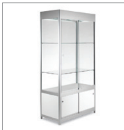
Schrankvitrine GRIANTE 100 EUR 330,00 Pos.-Nr. 61-178

Maße: B: 123 cm / T: 60 cm / H: 115 cm hinterleuchtete Front flexible Farbwechsoption abschließbar, 1 Einlegeboden