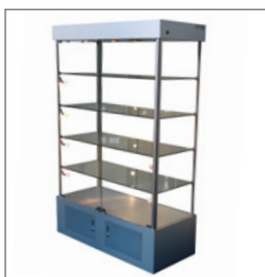
Vitrine BERLIN EUR 330,00 Pos.-Nr. 61-083

Maße: B: 80 cm / T: 40 cm / H: 198 cm mit Drehtüren, abschließbar Profile: Aluminium matt mit Beleuchtung