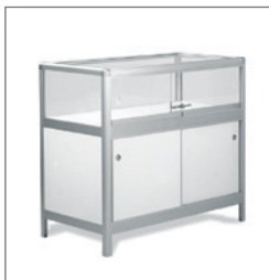
Vitrine ETNA 100 EUR 197,00 Pos.-Nr. 61-179

Maße: B: 51 cm / T: 51 cm / H: 200 cm Drehtüren, abschließbar mit Beleuchtung