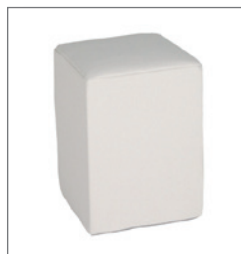
Hocker HOLLY EUR 20,00 Pos.-Nr. 61-233 weiß (01) Maße: B: 40 cm / T: 40 cm / H: 47 cm Sitzhöhe: 47 cm