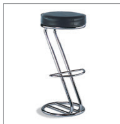
Barhocker PATTI EUR 29,00 Pos.-Nr. 61-103 weiß (01) schwarz (02) Maße: ø: 35 cm / H: 82 cm Sitzhöhe: 82 cm Sitz: Kunstleder