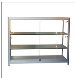
Vitrine PARIS EUR 197,00 Pos.-Nr. 61-081

Maße: B: 80 cm / T: 40 cm / H: 198 cm mit Drehtüren, abschließbar Profile: Aluminium matt mit Beleuchtung