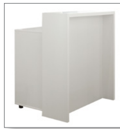
Theke CANNES EUR 390,00 Pos.-Nr. 61-250

Maße: B: 100 cm / T: 55 cm / H: 90 und 110 cm abschließbar, mit Einlegeboden Korpus: lichtgrau