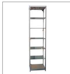
Vitrine LONDON EUR 260,00 Pos.-Nr. 61-080

Maße: B: 99 cm / T: 53 cm / H: 91 cm Vitrinenraum und Schrankraum mit Schiebetüren, abschließbar