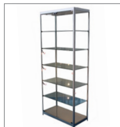
Vitrine AMSTERDAM EUR 330,00 Pos.-Nr. 61-082

Maße: B: 120 cm / T: 50 cm / H: 94 cm mit Schiebetüren, abschließbar Profile: Aluminium matt mit Beleuchtung