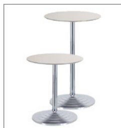
Tisch 70 Pos.-Nr. 61-277 EUR 102,00 Stehtisch 110 Pos.-Nr. 61-279 EUR 108,00 Platte: Glas satiniert (28) Maße: H: 70 cm + 110 cm ø Platte: 70 cm Gestell: Aluminium