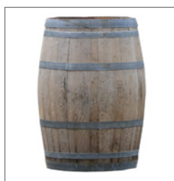
Stehtisch WEINFASS EUR 59,00 Pos.-Nr. 61-148 Eiche (19) Maße: H: 95 cm, ø 58 cm