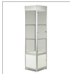
Hochvitrine GRIANTE 50 EUR 260,00 Pos.-Nr. 61-177

Maße: B: 100 cm / T: 51 cm / H: 200 cm Schiebetüren, abschließbar mit Beleuchtung