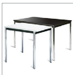
Tisch MEDOLA 80 EUR 45,00 Pos.-Nr. 61-140 weiß (01) schwarz (02) Tisch MEDOLA 120 EUR 53,00 Pos.-Nr. 61-141 weiß (01) schwarz (02) Maße: B: 80 + 120 cm / T: 80 cm / H: 75 cm Gestell: verchromt

Alle genannten Preise verstehen sich zuzüglich der jeweils gültigen gesetzlichen Umsatzsteuer (nach UStG in der jeweils neuesten Fassung). Nur in Verbindung mit Systemstand RUCK/STYLE/RUCK X-LARGE/MODERN/ASTRA möglich.