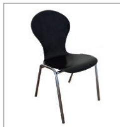
Stuhl ADAM EUR 33,50 Pos.-Nr. 61-282 schwarz (02) Maße: B: 46 cm / T: 47 cm / H: 86 cm Sitzhöhe: 46 cm Sitzschale: Holz lackiert