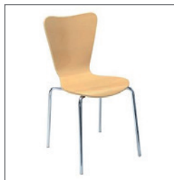
Stuhl EVA EUR 33,50 Pos.-Nr. 61-098 Buche natur (13) Maße: B: 47 cm / T: 57 cm / H: 84 cm Sitzhöhe: 47 cm Sitzschale: Holz lackiert