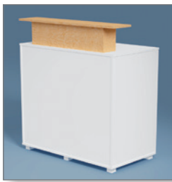
Theke NIZZA EUR 136,00 Pos.-Nr. 61-301

Theke NIZZA mit Aufsatz EUR 159,50 Pos.-Nr. 61-107 Aufsatz: lichtgrau (03) Aufsatz: Buche (16)