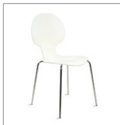
Stuhl BUNNY EUR 33,50 Pos.-Nr. 61-101 weiß (01) Maße: B: 52 cm / T: 53 cm / H: 85 cm Sitzhöhe: 47 cm Sitz/Rücken: Holz lackiert