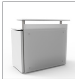
Theke SUN EUR 199,00 Pos.-Nr. 61-283

Maße: B: 120 cm / T: 60 cm / H: 110 cm Korpus: lichtgrau