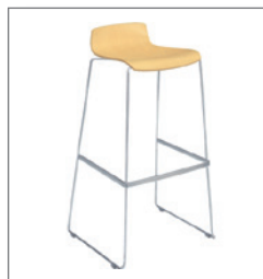
Barhocker YPSILON EUR 39,50 Pos.-Nr. 61-180 weiß (01) Buche natur (16) Maße: B: 51 cm / T: 39 cm / H: 90 cm Sitzhöhe: 80 cm Sitzschale: Holz lackiert / laminiert