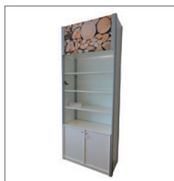
Kombiblock SUSANNE EUR 301,00 Pos.-Nr. 61-241

Maße: B: 99 cm / T: 44 cm / H: 250 cm 3 Ablagen (schräg/gerade) Sideboard abschließbar mit Einlegeboden