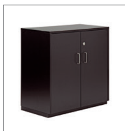
Sideboard BELLANO EUR 100,00 Pos.-Nr. 61-111