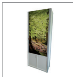
Kombiblock MARKUS EUR 290,00 Pos.-Nr. 61-242

Maße: B: 99 cm / T: 44 cm / H: 250 cm 3 Ablagen (schräg/gerade) Sideboard abschließbar mit Einlegeboden Leuchtkasten: 50 cm x 88 cm