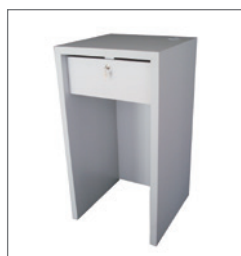
PC-Counter NINA EUR 141,00 Pos.-Nr. 61-256

Maße: B: 80 cm / T: 40 cm / H: 79 cm Drehtüren, abschließbar 1 Einlegeboden