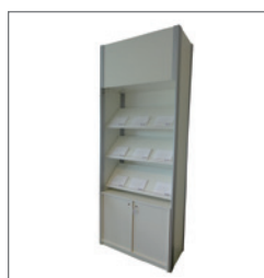
Kombiblock STEFFI EUR 215,50 Pos.-Nr. 61-240

Maße: B: 30 cm / T: 29 cm / H: 170 cm Gestell: Metall alufarben Böden: Holz