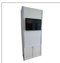
Kombiblock ANDREAS EUR 294,00 Pos.-Nr. 61-243

Maße: B: 99 cm / T: 44 cm / H: 250 cm Sideboard abschließbar mit Einlegeboden Leuchtkasten: 180 cm x 88 cm