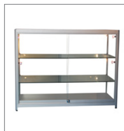
Vitrine PARIS EUR 194,00 Pos.-Nr. 61-081

Maße: B: 80 cm / T: 40 cm / H: 198 cm mit Drehtüren, abschließbar Profile: Aluminium matt mit Beleuchtung