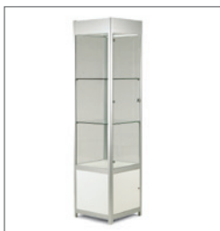
Hochvitrine GRIANTE 50 EUR 257,00 Pos.-Nr. 61-177

Maße: B: 100 cm / T: 51 cm / H: 200 cm Schiebetüren, abschließbar mit Beleuchtung