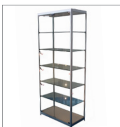
Vitrine AMSTERDAM EUR 325,00 Pos.-Nr. 61-082

Maße: B: 120 cm / T: 50 cm / H: 94 cm mit Schiebetüren, abschließbar Profile: Aluminium matt mit Beleuchtung