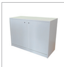
Sideboard MANFRED EUR 92,50 Pos.-Nr. 61-230

Maße: B: 55 cm / T: 55 cm / H: 105 cm mit Steckdose, abschließbar