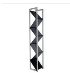
Prospektständer CORI EUR 97,00 Pos.-Nr. 61-104

Maße: B: 30 cm / T: 50 cm / H: 130 cm Holz lackiert 3 Fächer DIN A4