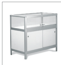
Vitrine ETNA 100 EUR 194,00 Pos.-Nr. 61-179

Maße: B: 51 cm / T: 51 cm / H: 200 cm Drehtüren, abschließbar mit Beleuchtung