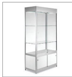
Schrankvitrine GRIANTE 100 EUR 325,00 Pos.-Nr. 61-178

Maße: B: 120 cm / T: 60 cm / H: 110 cm Korpus: lichtgrau